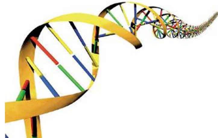
T. J. Watson, Jr.

If everyone in IBM who hires new employees will observe this rule, the corporation will obtain the type of people it requires, and at the same time we will be affording an equal opportunity to all in accordance with American tradition.